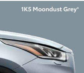
1K5 Moondust Grey*