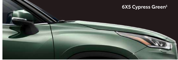
6X5 Cypress Green §