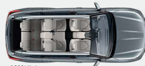
7 posti 332* litri

Qualunque siano le tue esigenze, ovunque tu stia andando, Toyota Highlander Hybrid offre un'ampia gamma di configurazioni dei posti a sedere.