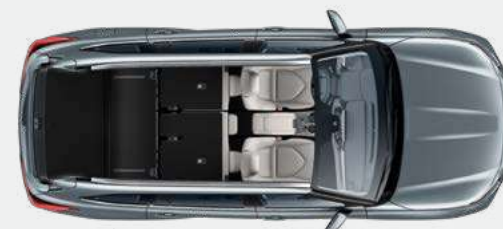
2 posti 1.909* litri