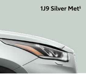
1J9 Silver Met §