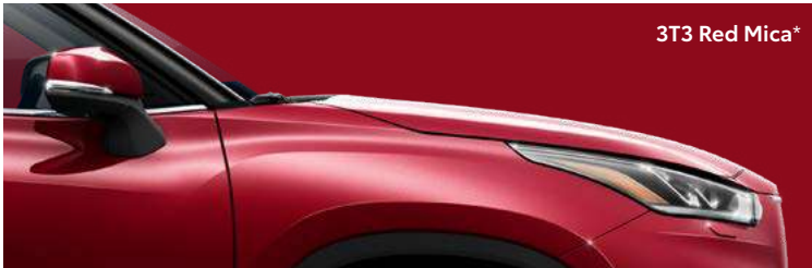
3T3 Red Mica*