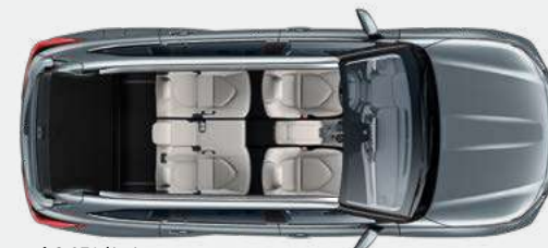
5 posti 865* litri