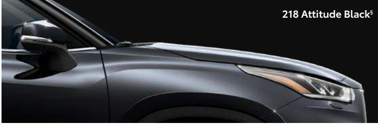
218 Attitude Black §